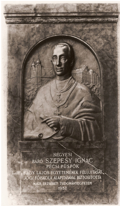
24. kép – Szepesy Ignác 1937-es emléktáblája

A jogi kar azonban nem mondott le az emléktábla és a centenárium megünneplésének tervéről, 1935-ben a rektor támogatását kérték az ügyben. A márvány emléktábla 1937-ben el is készült. Berán Lajos szobrászművész alkotásának közepén Szepesy Ignác portréja helyezkedett el, bal válla felett a Lyceum templom, jobb válla felett a liceum épülete kapott helyet. Felirata a következő volt: „Nagy Lajos egyetemének felújítását jogi főiskola alapításával biztosította”. Az emléktábla felirata az Erzsébet Tudományegyetem, a jogliceum és a középkori pécsi egyetem között teremtett kapcsolatot, kifejezve azt, hogy az Erzsébet Tudományegyetem mindkét intézményt elődjének tekinti. A központi épület jogi kari szárnyának árkádsor felé eső falán elhelyezett emléktáblát 1937. június 20-án ünnepi keretek között avatták fel. 85 Az eseményről, illetve az emléktábláról maradtak fenn fotók.