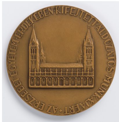
2. kép – Az Erzsébet Egyetem Barátainak Egyesülete érme elő- és hátlapja