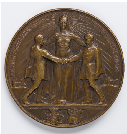
1. kép – Az Erzsébet Egyetem alapítási és költözési emlékérmének elő- és hátlapja