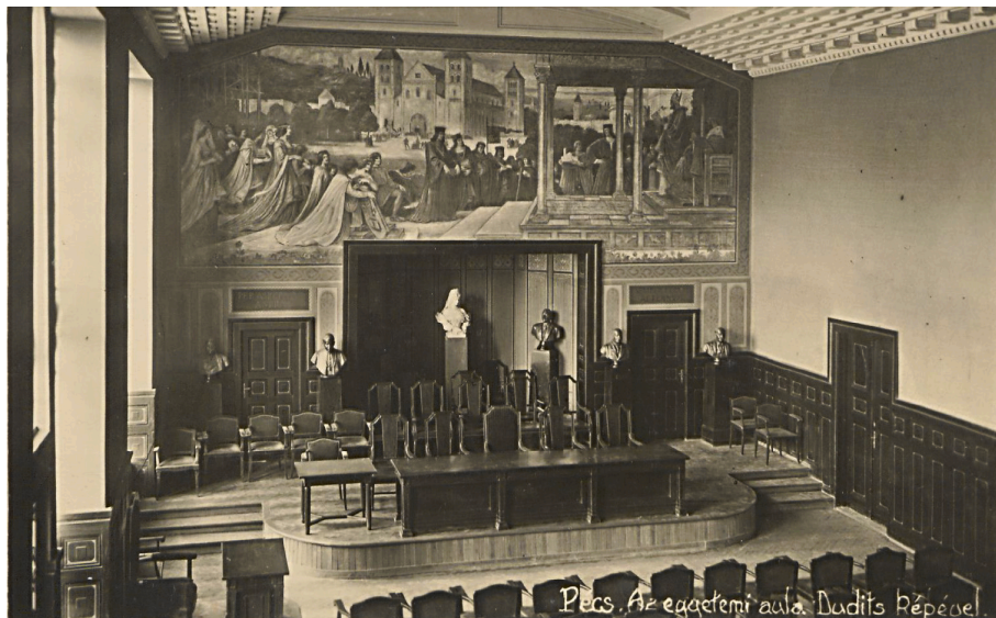
16. kép – Erzsébet-mellszobor az egyetem dísztermében

A Magyar Királyi Erzsébet Tudományegyetem első pécsi tanévnyitóján az egyetem dísztermében, a Dudits-freskó alatti fülkében már állt az a porcelánból készült mellszobor, amely ma is itt, a Halasy-Nagy József Aulában látható. Az alkotás Stróbl Alajos szobrászművész mintája alapján a Zsolnay gyárban készült. 37