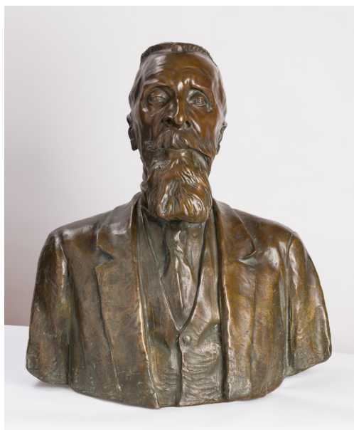
19. kép – Apponyi Albert szobra