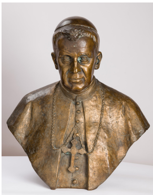
20. kép – Zichy Gyula szobra

Liipola finn szobrászművész politikai okok miatt menekült 1904-ben Magyarországra. Stróbl Alajos, majd Zala György műtermében dolgozott, s rövid időn belül saját műtermet tudott nyitni. Kiállításai közül talán az 1925-ös, Budapesten megrendezett tárlat volt a legsikeresebb. Műveinek jelentős részét, több mint 100 műalkotását hazánkban készítette. 63 A pécsi egyetemi megbízást felesége rokoni kapcsolatai révén kapta meg. 64