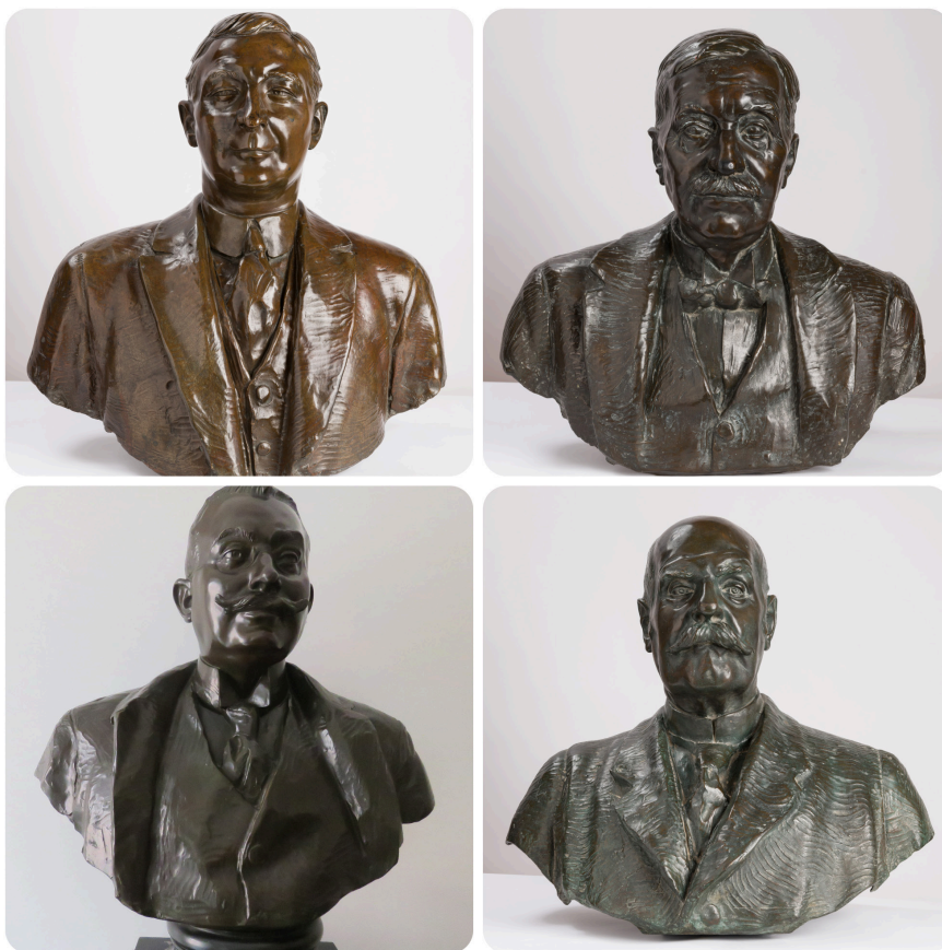
18. kép – Klebelsberg Kuno, Korb Flóris, Pekár Mihály és Tóth Lajos mellszobra

megfelelő formában elismerni. Ezért mi[,] közvetlen szemlélői és megértői e nehéz küzdelmeknek, tartottuk kötelességünknek, hogy az elismerés adóját lerójjuk és e nemes alakokban az utódoknak követendő példát állítsunk. [sic!] 55