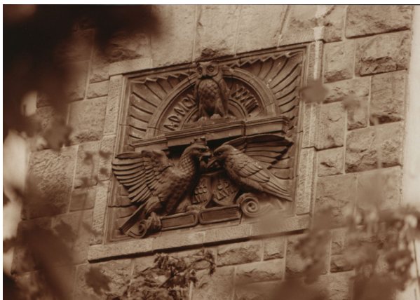
23. kép – Egyetemalapítás dombormű

Az épület déli oldalán található emléktábla szintén az Erzsébet Tudományegyetem és az elődöknek tekintett intézmények között teremt szimbolikus kapcsolatot. A dombormű három madáralakot és három évszámot ábrázol: az 1367-es évszám és a koronás sas alakja Nagy Lajost és a középkori pécsi egyetemalapítást szimbolizálja, az 1467-es évszám és a holló Mátyás király és Pozsonyban alapított Academia Istropolitana jelképe, 1933 és a bagoly alakja az újonnan emelt jogi kari szárnyat és az Erzsébet Tudományegyetemet jeleníti meg. 81