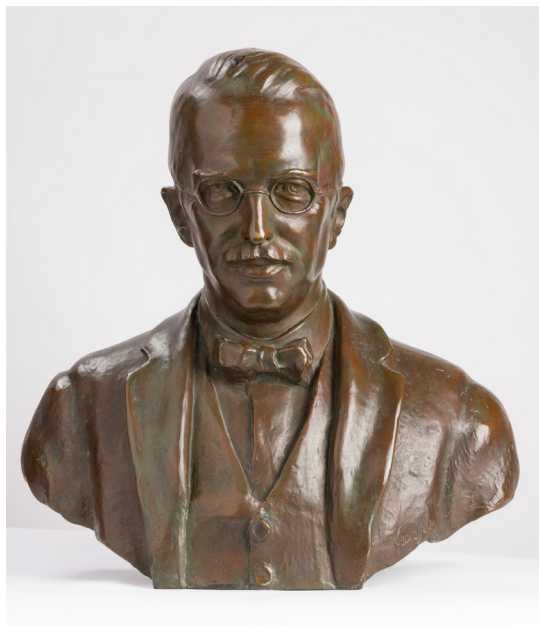
21. kép – Heim Pál mellszobra