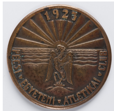
5. kép – PEAC-érem a hármas halmon álló sassal