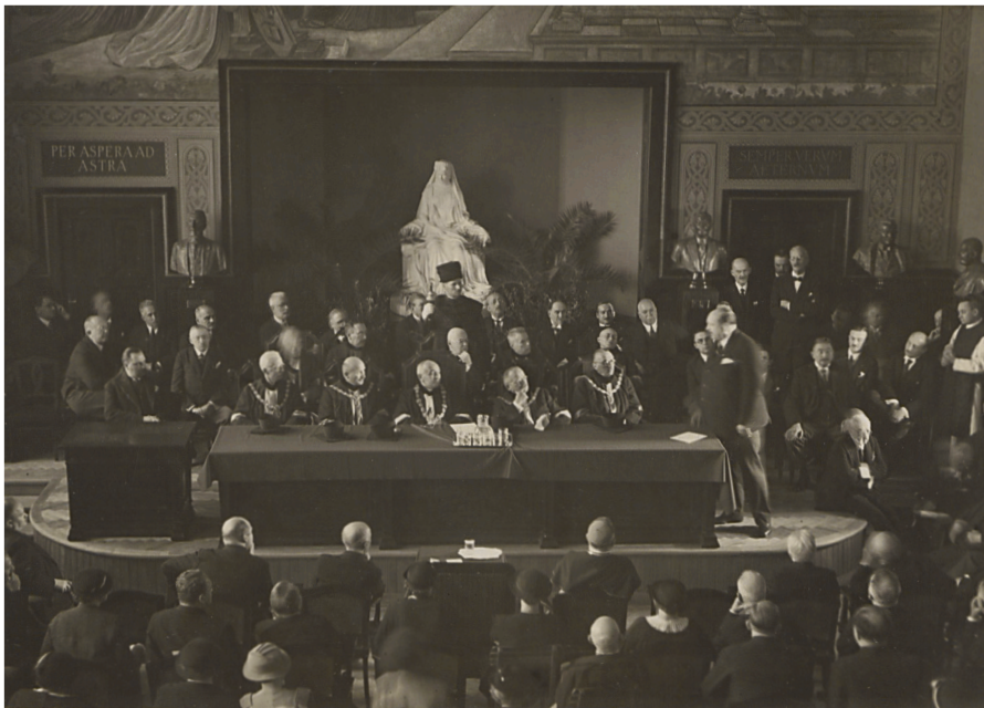
17. kép – Hóman Bálint kultuszminiszter díszdoktori előadása 1935-ben, a háttérben Szentgyörgyi István egész alakos Erzsébet-szobra

Az egyetem egyetlen egész alakos Erzsébet-szobra Szentgyörgyi István alkotása. Felvinczi Takáts Zoltán, az egyetem magántanára 1933 elején jelezte a rektornak, hogy a Szépművészeti Múzeumban van egy Szentgyörgyi István által készített életnagyságú gipszszobor, amelyet a szobrászművész az Erzsébet királyné-szoborpályázatra készített, és amelyet a múzeum letétbe adna az egyetemnek, amelynek mindössze a szállítási költséget kellene kifizetnie. A rektor felvetette, hogy a műalkotást a központi épület előcsarnokába vagy a díszterembe helyezhetnék el. A szoborral kapcsolatban azonban több probléma is felmerült: a szállítási költség mellett felvetődött a szobor gipsszel való befűvésének többeltköltsége, valamint az alkotás mérete és anyaga miatt az elhelyezés nehézsége is. A végleges döntés előtt felkérték a jogi kari prodékánt, Krisztics Sándort, hogy tartson helyszíni